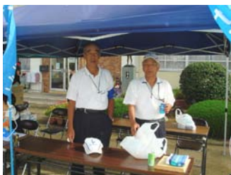
2011/09 中央小学校運動会敬老招待者に弁当配布